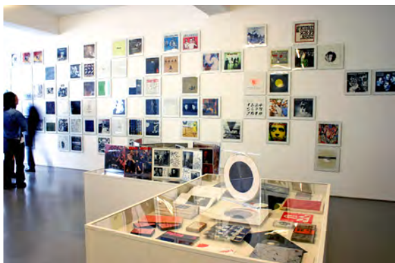
Vue de l'exposition : Guy Schraenen, Vinyl – Records and Covers by Artists , Weserburg, Museum of modern art, Brême, 2005.