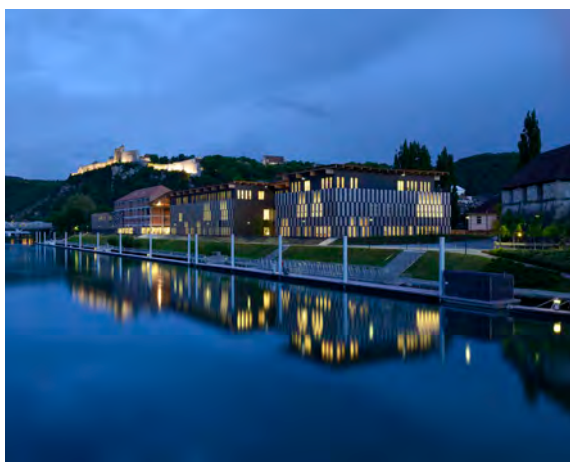
Frac Franche-Comté, Cité des arts, Besançon © Kengo Kuma & Associates / Archidev, crédit photo : Nicolas Waltefaugle

Le Fonds régional d'art contemporain de Franche-Comté est l'un des 23 Fonds Régionaux d'Art Contemporain créés en 1982, dans le cadre de la politique de décentralisation mise en place par l'État. Il est financé par la Région (70%) et l'État (30%) qui contribuent également aux acquisitions d'œuvres.