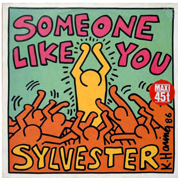
Keith Haring ; Sylvester, Someone like you , Warner Bros. Records Inc. 1986. Sound Collection Guy Schraenen / Centre de recherche pour les publications d'artistes / Musée d'art moderne Weserburg, Brême