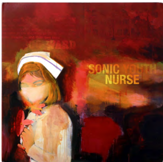
Richard Prince ; Sonic Youth, Sonic Nurse , Geffen Records, Inc, 2004. Sound Collection Guy Schraenen / Centre de recherche pour les publications d'artistes / Musée d'art moderne Weserburg, Brême