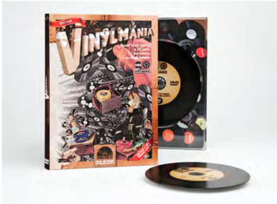
Paolo Campana, Vinylmania , 2011

disparition, les disques vinyles se portent plutôt bien. Un engouement inédit pour ces objets permet de s'interroger sur la nature de cette manifestation culturelle : s'agit-il d'une réaction à la culture du zapping représentée par l'iPod et le MP3 ? Ou bien d'une réponse nostalgique vis-à-vis de la dématérialisation de la musique... voire, une quête d'identité ? Le réalisateur Paolo Campana, qui possède lui-même plus de 3000 vinyles, enquête sur ce qu'il considère comme un phénomène culturel. Le récit de son voyage étonnant se nourrit de témoignages de disquaires, de DJs, d'artistes, de collectionneurs, d'adolescents, d'experts et d'amoureux de la musique.