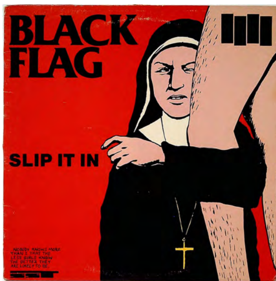
Raymond Pettibon ; Black Flag, Slip it in , SST Records, Lawndale, 1985. Sound Collection Guy Schraenen / Centre de recherche pour les publications d'artistes / Musée d'art moderne Weserburg, Brême