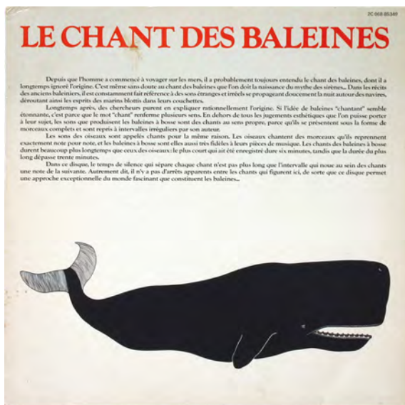
Le Chant des Baleines , Capitol Records, 1978. Sound Collection Guy Schraenen / Centre de recherche pour les publications d'artistes / Musée d'art moderne Weserburg, Brême

L'exposition réunit de nombreuses pochettes de vinyles, issues de la collection de Guy Schraenen. De nombreux artistes, musiciens et poètes ont collaboré autour de la réalisation de pochettes de vinyles. Ces rencontres entre le visuel et le sonore ont-elles une place à part dans l'art du XX e siècle ?