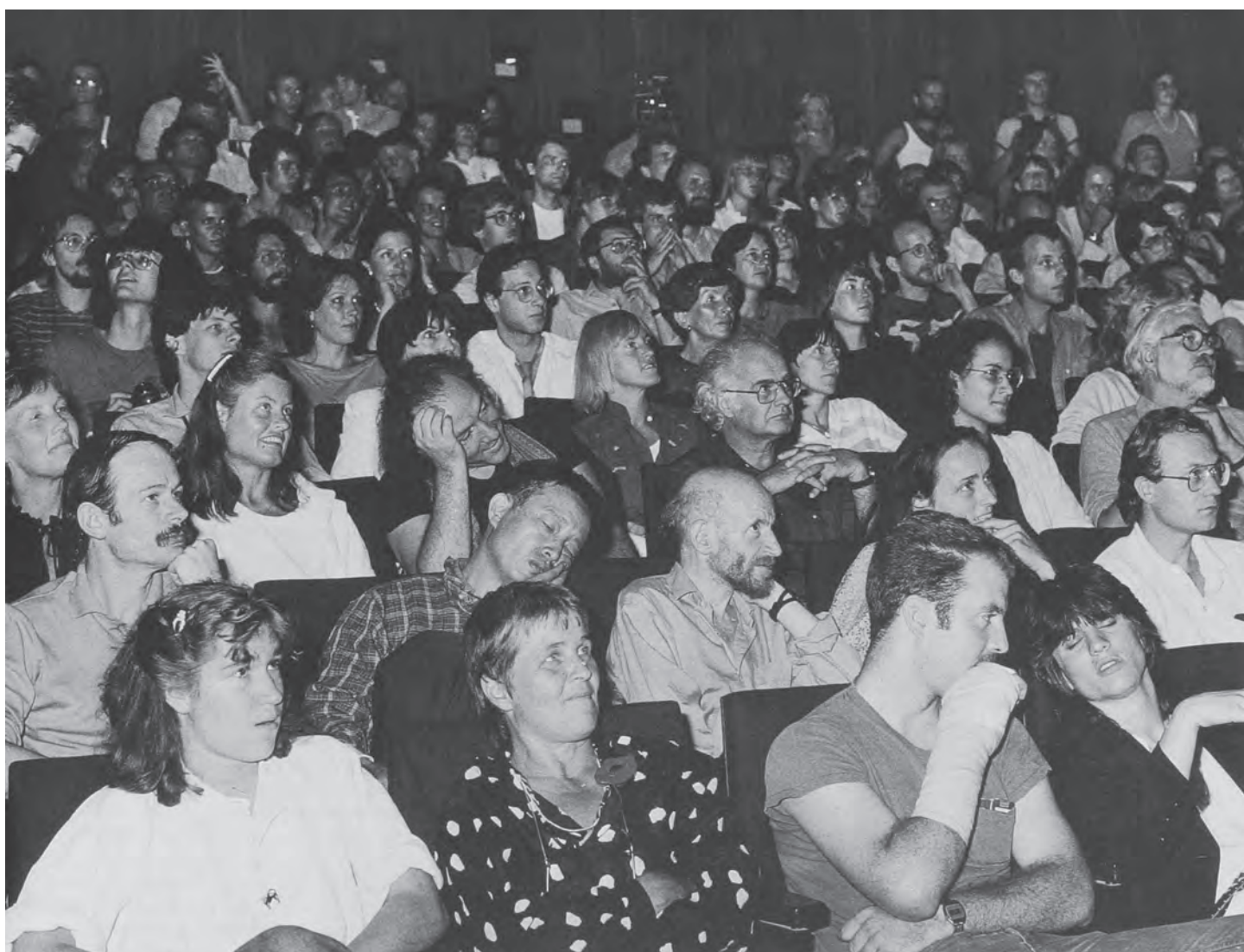
Public à un concert Fluxus, 1962.