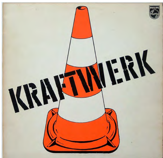
Ralf Hütter, Kraftwerk, Kraftwerk , Philips, 1970. Sound Collection Guy Schraenen / Centre de recherche pour les publications d'artistes / Musée d'art moderne Weserburg, Brême © DR, photo : Bettina Brach