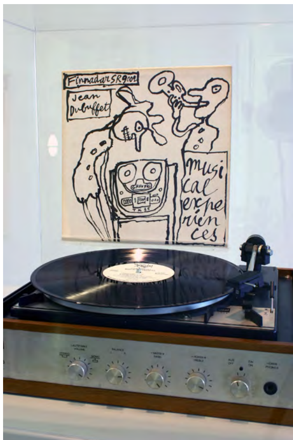
Vue d'exposition ; Jean Dubuffet, Musical Experiences , LP, 1973 Sound Collection Guy Schraenen / Centre de recherche pour les publications d'artistes / Musée d'art moderne Weserburg, Brême